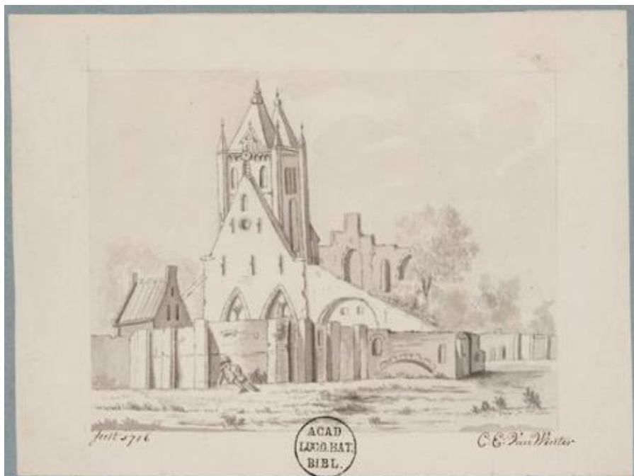
C.E. van Winter, Ruïne van de kerk van Voorschoten, 1786, Universiteitsbibliotheek Leiden

Gezien de deplorabele staat van het kerkgebouw na het beleg is het een wonder dat een deel van het middeleeuws archief van Voorschoten uitgerekend in een kerkkist behouden is gebleven. Om met J.L. van de Gouw te spreken; ‘in Voorschoten heeft men op onnaspeurlijke wijze kans gezien om de kerkkist uit de ramp te redden’ 6 .