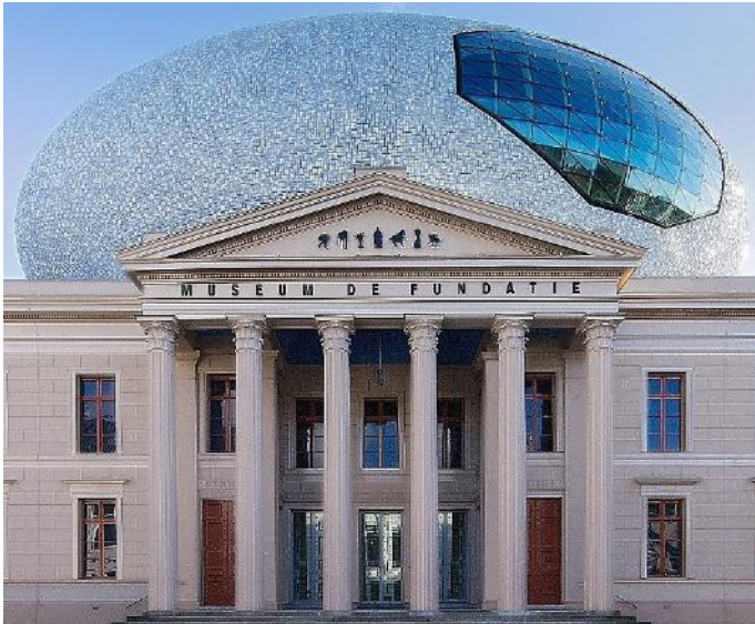
Voorzijde van Museum de Fundatie

genoemd. En Museum de Fundatie in Zwolle draagt sinds enige tijd een 'iconische' wolk. We hebben hier te maken met een vorm van iconische architectuur.