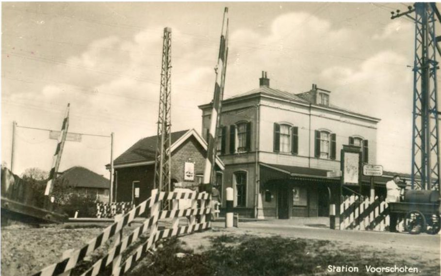
Het oude station, ca. 1946

Kortom, het is een bijeenkomst die u niet mag missen want de historie van Voorschoten is een boeiend onderwerp waar mevrouw De Glopper met verve over kan vertellen en waarvan zij foto's en archiefmateriaal zal laten zien.