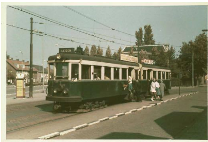
De Blauwe Tram

Met de komst van deze vele forensen kwam er behoefte aan meer openbaar vervoer. Vreemd genoeg werd juist de Blauwe Tram in 1961 opgeheven. Deze tram, die op de lijn van Den Haag naar Leiden ook Voorschoten aandeed, kreeg steeds minder reizigers doordat steeds meer mensen een auto kregen. Maar forensen merkten al snel dat de auto ook zo z'n nadelen had. Verkeersopstoppingen, zoals files in deze periode nog vaak genoemd werden, en parkeerproblemen bleken de keerzijde van het autobezit. Hoewel Voorschoten al heel vroeg een station had, was het treinverkeer in de oorlog stilgelegd en nooit meer op gang gekomen. De onvermoeibare burgemeester De Kool sloeg opnieuw aan het lobbyen en wederom met succes. In 1969 werd het station Voorschoten heropend.